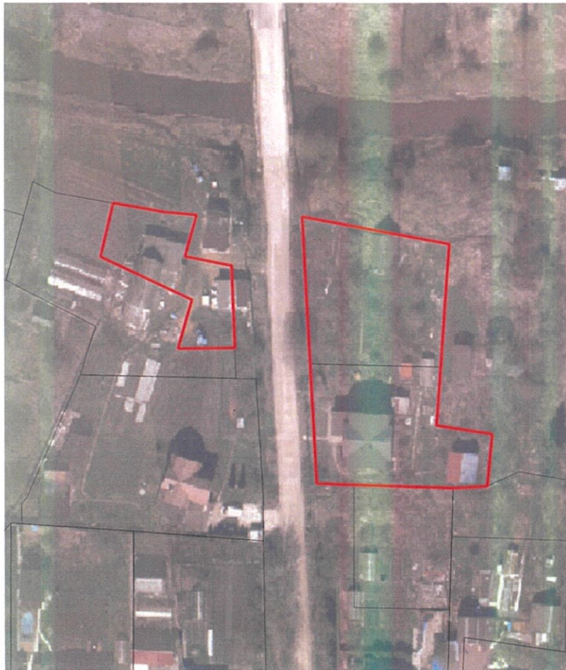
Схема границ территории подготовки проекта о внесении изменений в правила землепользования и застройки муниципального образования Горбунковское сельское поселение муниципального образования Ломоносовский муниципальный район Ленинградской области применительно к части территории поселения

Приложение к распоряжению комитета градостроительной политики Ленинградской области от 28 апреля 2026 года № 127