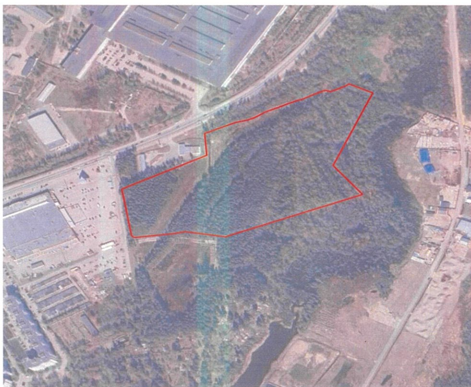
Схема границ территории подготовки 1 этапа проекта правил землепользования и застройки муниципального образования «Новодевяткинское сельское» Всеволожского муниципального района Ленинградской области