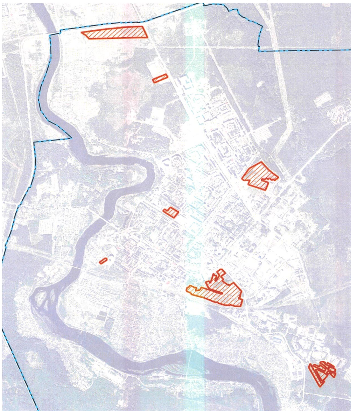
Схема границ территории подготовки 1 этапа проекта правил землепользования и застройки муниципального образования «Кингисеппское городское поселение» муниципального образования «Кингисеппский муниципальный район» Ленинградской области