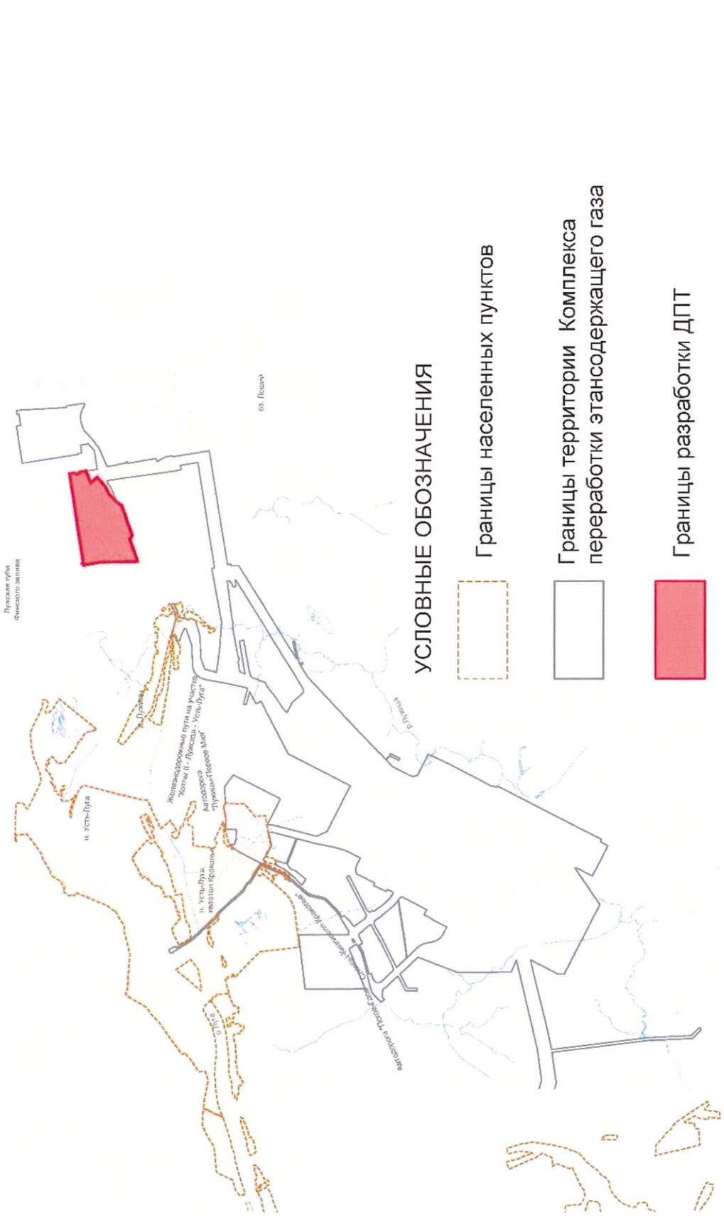
Схема границ территории проектирования

Граница территории, применительно к которой осуществляется подготовка документации по планировке территории