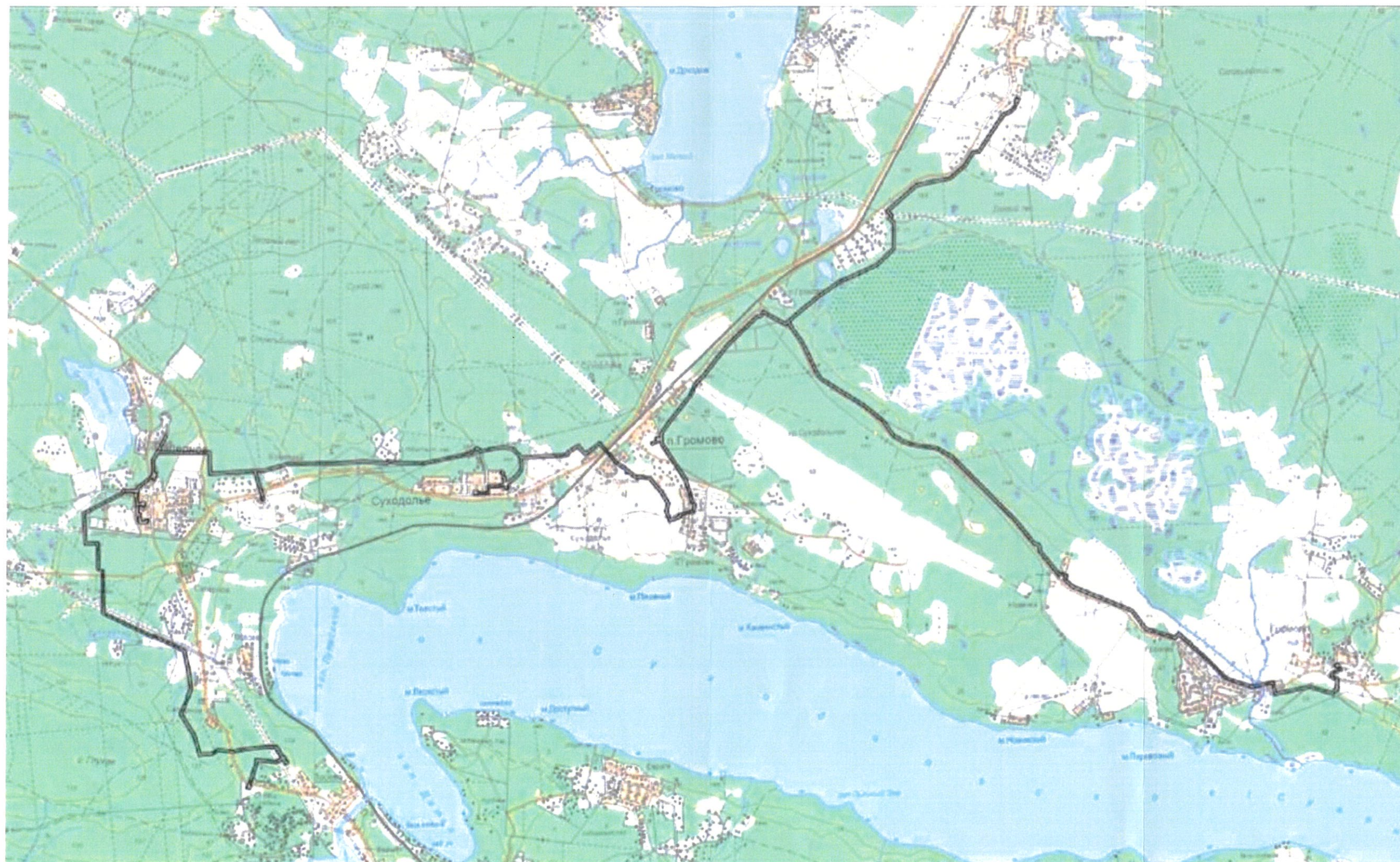
Схема границ территории проектирования