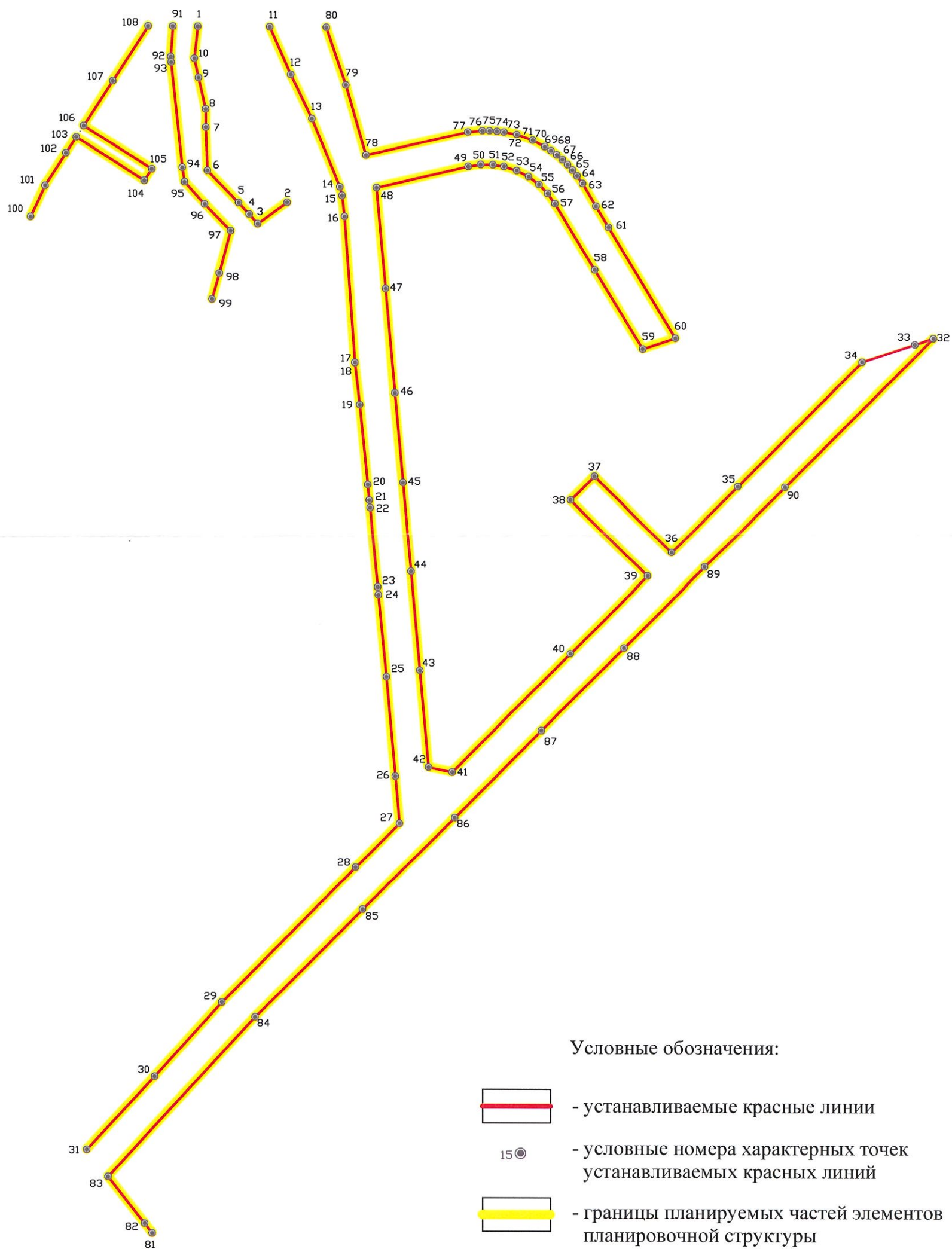
Чертеж планировки территории, отображающий красные линии, границы элементов планировочной структуры