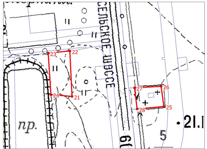
Масштаб 1:3 000