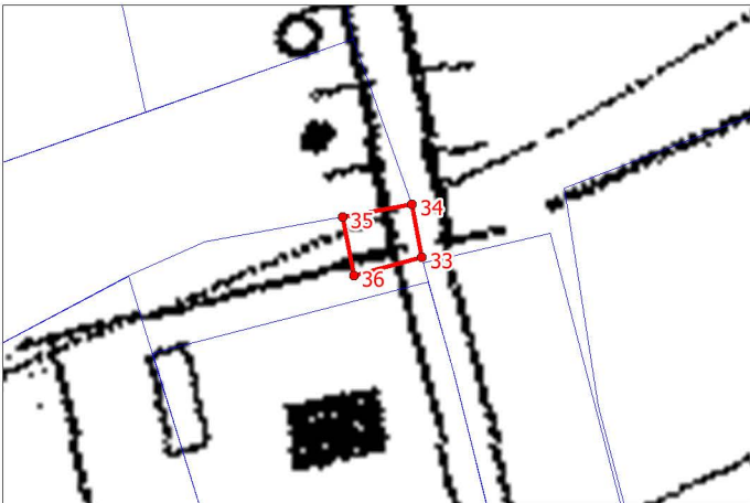
Масштаб 1:1 000